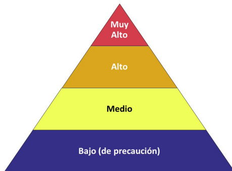
Pirámide de riesgo ocupacional para el COVID-19

El riesgo de los trabajadores por la exposición ocupacional al SARS-CoV-2, el virus que causa el COVID-19, durante un brote podría variar de un riesgo muy alto a uno alto, medio o bajo (de precaución). El nivel de riesgo depende en parte del tipo de industria, la necesidad de contacto a menos de 6 pies de personas que se conoce o se sospecha que estén infectadas con el SARS-CoV-2, o el requerimiento de contacto repetido o prolongado con personas que se conoce o se sospecha que estén infectadas con el SARS-CoV-2. Para ayudar a los empleadores a determinar las precauciones apropiadas, OSHA ha dividido las tareas de trabajo en cuatro niveles de exposición a riesgo: muy alto, alto, medio y bajo. La Pirámide de riesgo ocupacional muestra los cuatro niveles de exposición a riesgo en la forma de una pirámide para representar la distribución probable del riesgo. La mayoría de los trabajadores norteamericanos probablemente estarán en los niveles de riesgo de exposición bajo (de precaución) o medio.